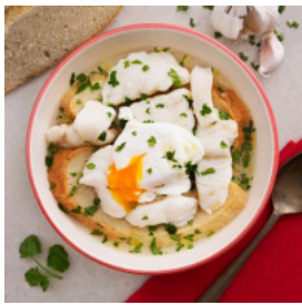
Açorda Alentejana de Bacalhau com Coentros