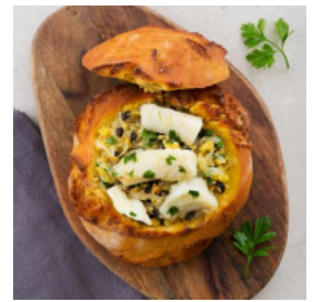
Bacalhau na Broa com Azeitonas e Salsa