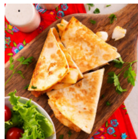
Quesadilla de Bacalhau e Tomate á Salsa