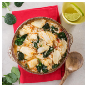
Arroz de Bacalhau com Espinafres