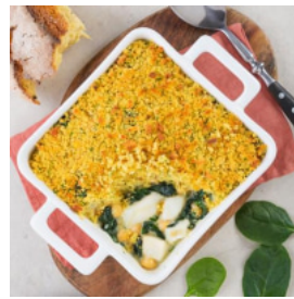
Bacalhau com Espinafres e Broa