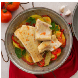
Bacalhau na Cataplana