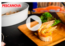
Camarão com Guacamole de Manga