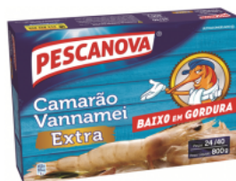
Camarão Vannamei Extra 24/40