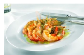
Camarão com Molho de Espumante