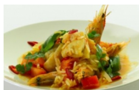
Arroz de Tamboril com Camarão Selvagem