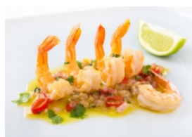
Camarão aos Aromas Asiáticos