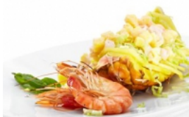
Ananás à Tesouro do Mar