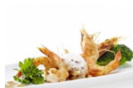
Camarão com Cerveja