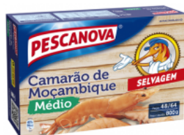
Camarão Moçambique Médio 48/64