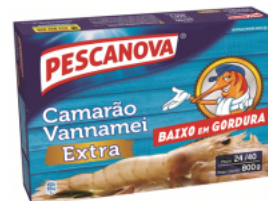
Camarão Vannamei Extra 24/40