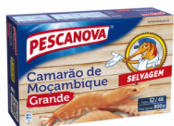
Camarão Moçambique Grande 32/48