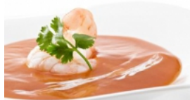
Aveludado de Marisco