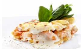
Bacalhau Gratinado com Camarões