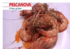
Camarão al Ajillo