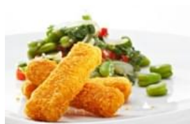
Barrinhas Ómega 3 com Salada Quente