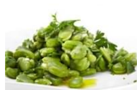
Salada de Favas