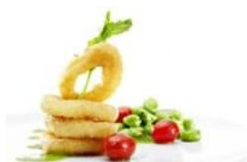
Caprichos do Mar com Salada Bicolor