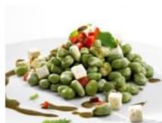
Salada Fria de Favas e Pimentos com Molho Balsâmico