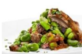
Entrecosto Guisado com Favas