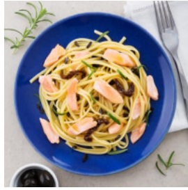
Linguine com Salmão, Azeitonas e Tomate Seco