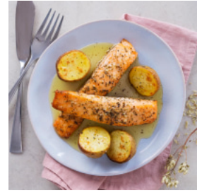
Medalhões de Salmão com Batatinhas aos Orégãos no Forno