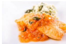
Medalhões de Salmão em Molho de Tomate