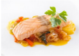
Caldeirada Simples de Salmão