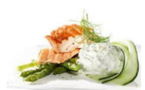
Medalhões de Salmão Grelhado com Molho Grego