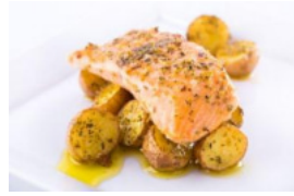
Medalhões de Salmão com Batatinhas aos Orégãos no Forno