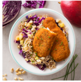
Filetes de Ervas Orientais com Noodles Coloridos