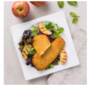
Filetes Forno com Ervas Aromáticas e Salada de Maçã Grelhada