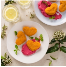
Corações de Pescada com Húmus de Beterraba à Hortelã