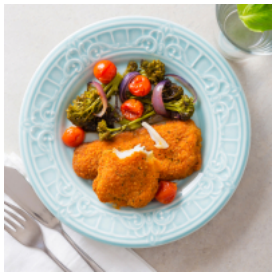
Filetes de Alho e Salsa com Vegetais no Forno