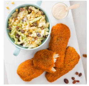
Filetes de Alho e Salsa com Salada Coleslaw