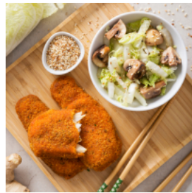
Filetes de Ervas Orientais com Vegetais no Wok