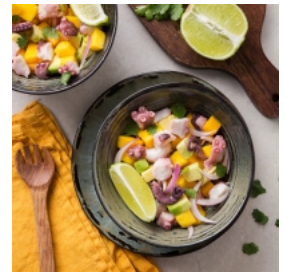
Ceviche de Polvo