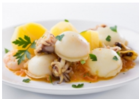
Chocos Estufados com Frutos do Mar