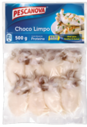
Choco Limpo 10/30