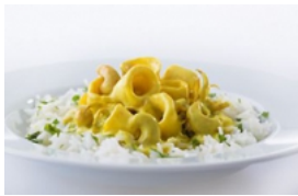
Caril de Lulas e Cajus com Arroz de Coentros