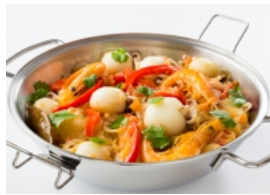
Cataplana de Chocos e Camarão aos Coentros