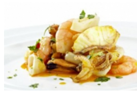
Cataplana de Peixe