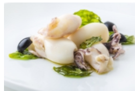
Lulas ao Manjeriçã com Azeitonas