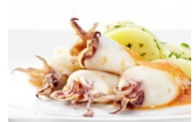
Lulas com Tomate