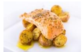
Medalhões de Salmão com Batatinhas aos Orégãos no Forno