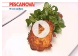
Carpaccio de Camarão e Salmão Marinado