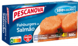
Fishburgers de Salmão