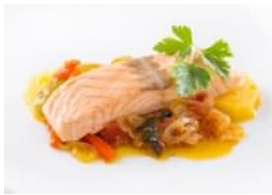
Caldeirada Simples de Salmão