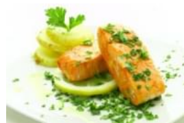
Medalhões de Salmão à Chef