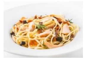
Linguine com Salmão, Azeitonas e Tomate Seco