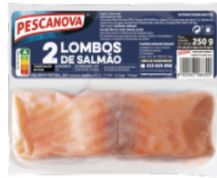
Lombras de Salmão