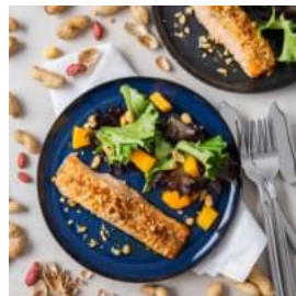
Lombras de Salmão no Forno com Crumble de Amendoins