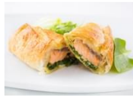
Folhado de Salmão com Espinafres e Mozzarella