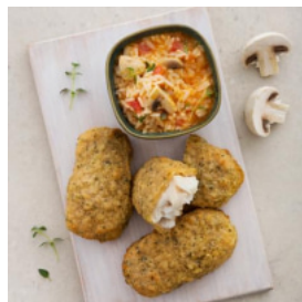
Mimos de Pescada com Arroz de Cogumelos e Tomilho