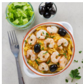
Brás Rápido de Camarão