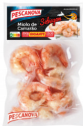
Miolo de Camarão Gigante 15/30 250 g