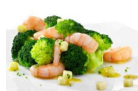
Brócolos com Miolo de Camarão