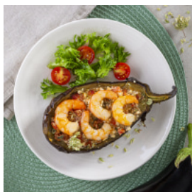
Beringelas Recheadas com Tomate, Feta e Camarão