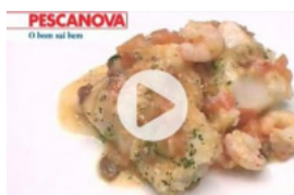
Bacalhau com Camarão e Passas