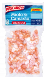
Miolo de Camarão Grande Cozido 40/60 200 g