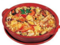
Arroz de Marisco à Pescanova