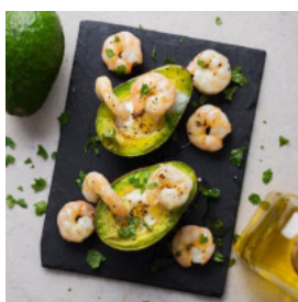
Abacates no Forno com Ovo e Camarão aos Coentros