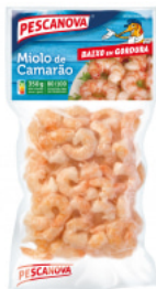
Miolo de Camarão 80/100 350 g 350 g