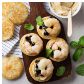
Blinis com Húmus, Azeitonas e Camarão Salteado