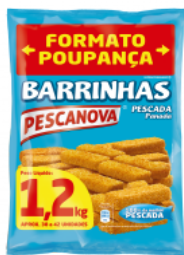
Barrinhas de Pescada Panada Embalagem: 1,2 kg