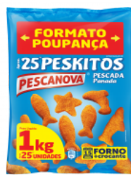
Peskitos de Pescada Panada Embalagem: 1 kg