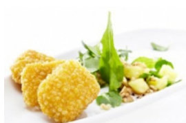
Nuggets de Pescada com Mistura de Alfaves