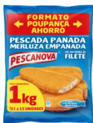
Pescada Panada em Forma de Filete Embalagem: 1 kg