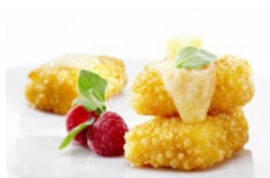
Nuggets de Pescada com Queijo da Ilha