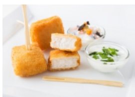
Espetos de Nuggets de Pescada com Dois Molhos