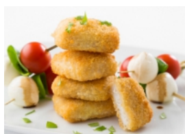
Nuggets de Pescada com Espeto Caprese