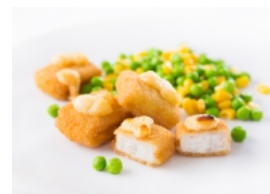
Nuggets de Pescada no Forno com Queijo