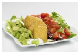
Nuggets de Pescada com Salada de Abacate e Tomate