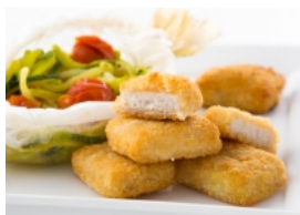
Nuggets de Pescada com Papelotes de Legumes