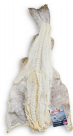
Bacalhau Salgado Seco - Islândia