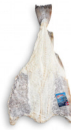
Bacalhau Salgado Seco - Noruega