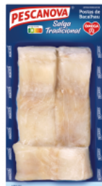
Postas de Bacalhau