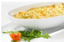
Bacalhau Espiritual Pescanova