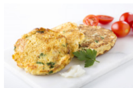
Pataniscas de Bacalhau e Couve-Flor