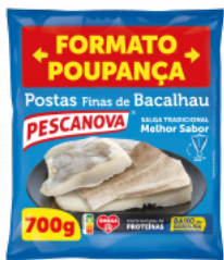
Postas Finas de Bacalhau