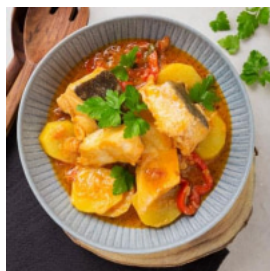
Caldeirada de Bacalhau