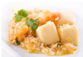
Arrozada de Tiras de Pota com Camarão aos Coentros