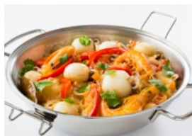
Cataplana de Chocos e Camarão aos Coentros