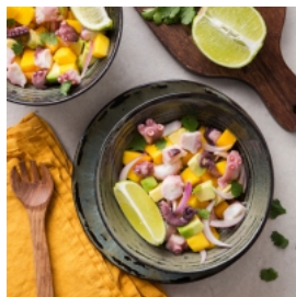
Ceviche de Polvo