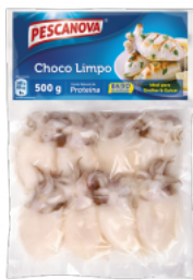
Choco Limpo 10/30