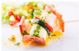
Espetadas de Tiras de Pota com Molho Aromático