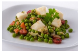
Guisado de Tiras de Pota com Ervilhas e Linguicinha