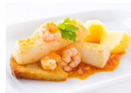
Ensopado de Tiras de Pota com Miolo de Camarão