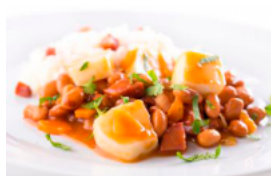
Feijoada de Tiras de Pota