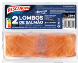
Lombos de Salmão