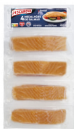
Medalhões de Salmão