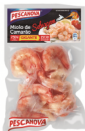
Miolo de Camarão Gigante 15/30