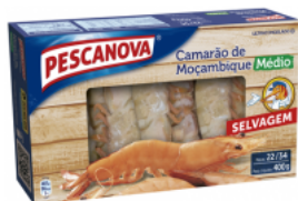
Camarão Moçambique 22/34