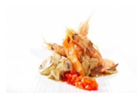
Camarão com Cogumelos