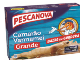
Camarão Vannamei Grande 40/48