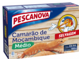
Camarão Moçambique Médio 48/64