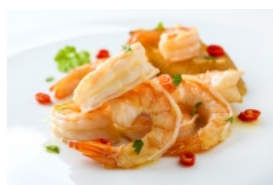
Camarão ao Alho, Coentros e Malagueta