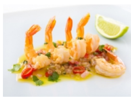
Camarão aos Aromas Asiáticos