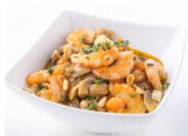
Camarão com Cogumelos e Pinhões ao Tomilho