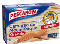
Camarão Moçambique Grande 32/48