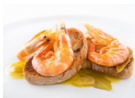
Camarão com Molho de Mostarda e Cerveja