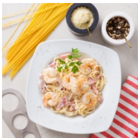
Camarões à Carbonara