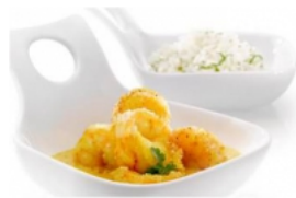
Caril de Miolo de Camarão Pescanova