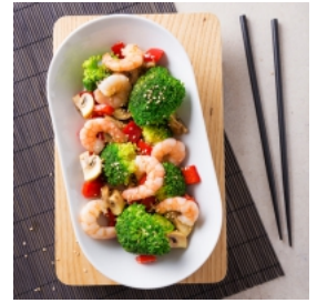
Camarão com Salada de Brócolos, Cogumelos e Pimentos