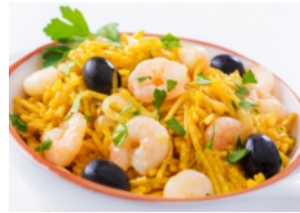
Brás Rápido de Camarão