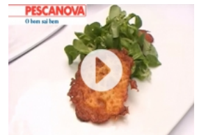
Carpacio de Camarão e Salmão Marinado