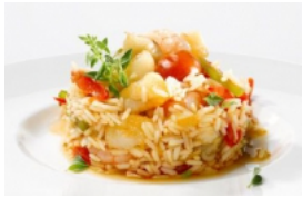
Arroz de Tamboril Pescanova