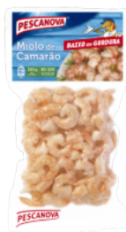
Miolo de Camarão 80/100