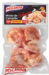
Miolo de Camarão Gigante 15/30