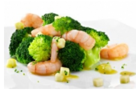
Brócolos com Miolo de Camarão