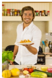
Caril de Miolo de Camarão by Lourenço Ortigão