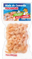
Miolo de Camarão 80/100 Embalagem: 350 g