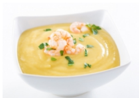
Creme de Grão com Miolo de Camarão e Salsa