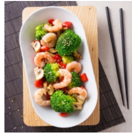
Camarão com Salada de Brócolos, Cogumelos e Pimentos