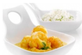
Caril de Miolo de Camarão Pescanova