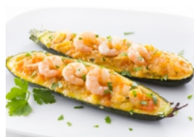
Curgetes Recheadas com Miolo de Camarão