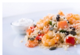
Cuscuz de Miolo de Camarão com Papaia, Tomate e Pimento