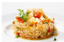
Arroz de Tamboril Pescanova