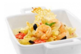
Empadão do Mar Pescanova