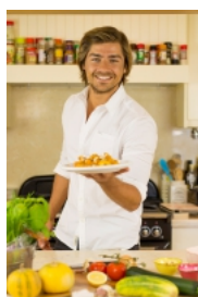
Caril de Miolo de Camarão by Lourenço Ortigão