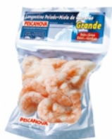
Miolo de Camarão Grande 40/60 Embalagem: 200 g