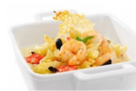
Empadão do Mar Pescanova