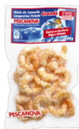
Miolo de Camarão Grande Cozido 40/60 Embalagem: 200 g