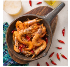
Camarões à Moçambicana no Forno