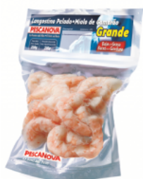
Miolo de Camarão Grande (40/60) Embalagem: 200 kg